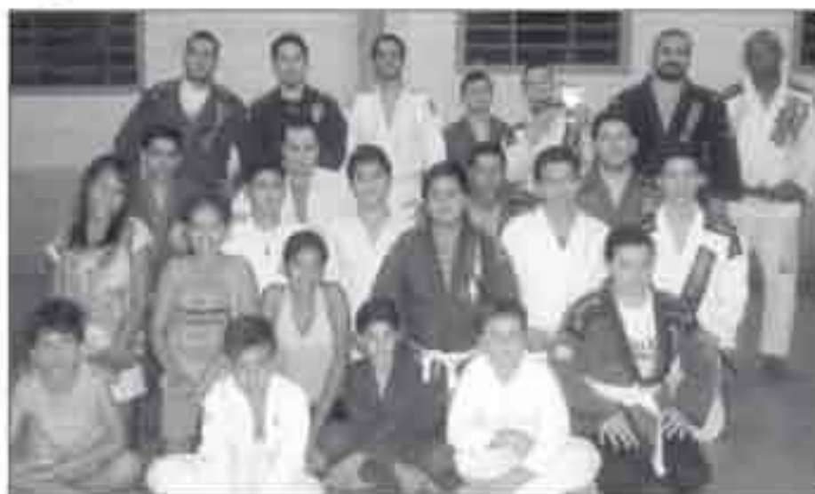
Projeto voltado para crianças e adolescentes que se encontram em situação de eminente risco social e pessoal

De acordo com o professor, o projeto tem como foco principal um trabalho voltado no relacionamento com a comunidade com atendimento a crianças e adolescentes carentes que se encontram em situação de eminente risco social e pessoal. "A missão é contribuir para a criação de condições e oportunidades afim de que todas as crianças e jovens possam desenvolver plenamente o seu potencial como pessoas, cidadãos e futuros profissionais, utilizando a atividade esportiva como