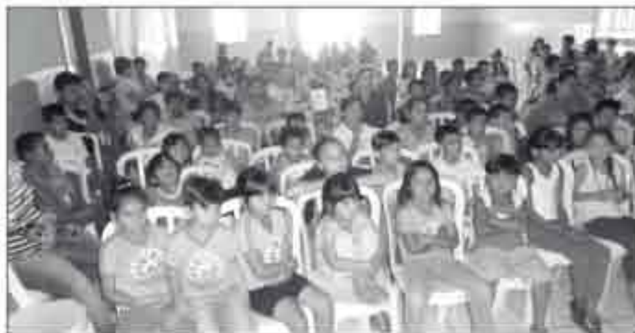
Crianças e adultos participaram e assistiram as sessões de cinema

A comunidade de Santa Amélia recebe hoje (12), às 10h30 e 15h30 no Salão Paroquial, sessões de cinema 'Olhar Itinerante'. A iniciativa é patrocinada pelo SESI/PR e oportuniza às cidades do interior do Estado a vivenciar o Olhar de Cinema - Festival Internacional de Curitiba. A mostra 'Olhar Itinerante' apresenta cinco curtas-metragens de cunho universal para mais de 20 cidades do Paraná, além de Curitiba, em sessões gratuitas. As exibições começaram no dia 07,