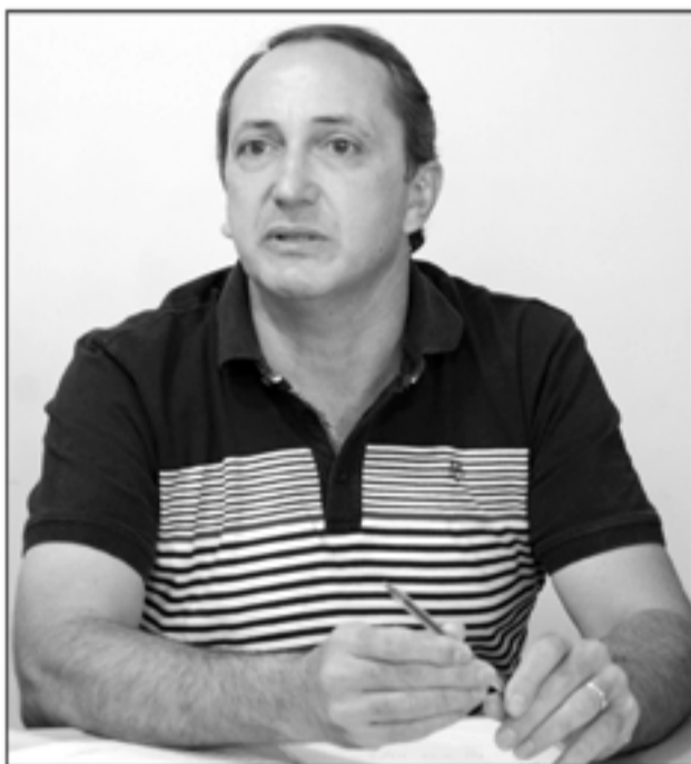
Prefeito municipal Celso Silva: prorrogação do pagamento à vista do IPTU

O prefeito municipal, Celso Silva, lembra que o Município não realizou reajuste do IPTU. "Não houve alteração dos valores do IPTU. É este imposto nossa principal fonte de arrecadação. E mesmo com todas as dificuldades econômicas, este ano não será diferente, os recursos deverão ser aplicados como um todo, na educação, saúde, assistência social, infraestrutura, e outros setores", ressaltou. Com relação a prorrogação do pagamento à vista do imposto, Celso Silva argumenta que entre os principais motivos para o Executivo ter entrado com Projeto de Lei é de que no mês de abril também ocorre o pagamento do IPVA (Imposto sobre a Propriedade de Veículos Automotores), que teve reajuste no final do