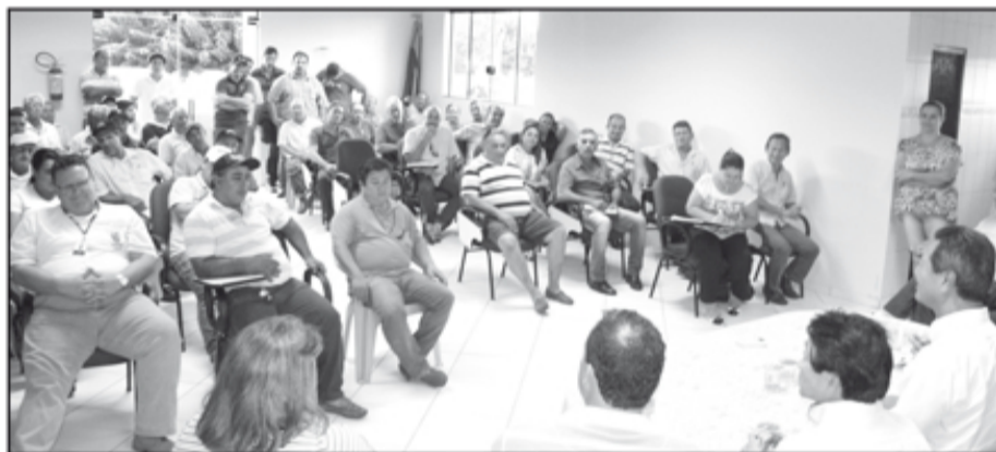
Produtores rurais do setor de estufas, autoridades, empresários e representantes de entidades reuniram-se com a Denso