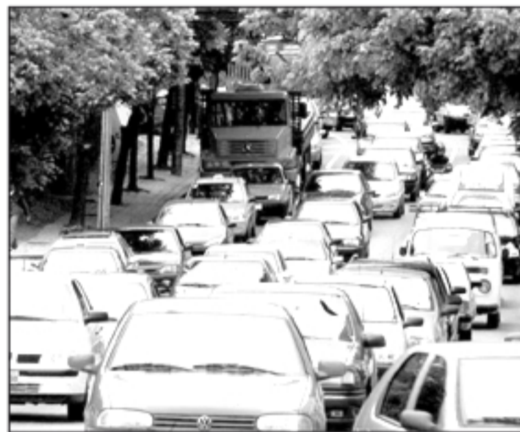
Proprietários de veículos devem ficar atentos aos prazos

O pagamento poderá ser feito por meio do boleto bancário enviado aos contribuintes ou diretamente nos bancos credenciados (Banco do Brasil, Bradesco, Itaú e Sicredi) com o número do Renavam do veículo. Uma outra opção é o uso de GRPR (Guia de Recolhimento do Estado do Paraná), que pode ser obtida no portal www.fazenda.pr.gov.br .