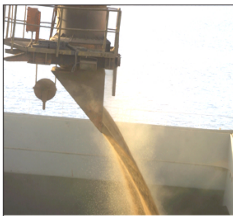
Complexo soja aparece entre os três principais grupos exportadores no quadrimestre de 2015 – 32,2% – seguido por Carnes (16,7%) e Madeira (7%).

As importações do quadrimestre tiveram queda de – 20,6% em relação ao mesmo período de 2014 e totalizaram US$ 4,259 bilhões. Os grupos que tiveram maior impacto nas importações do período são Produtos Químicos (23,4%), Mecânica (17,4%) e Material de Transportes (16,4%). O estudo da Fiep revela que a categoria que teve maior aumento nas importações entre 2008 e 2014 foi Bens de Consumo (821,9%). “O crescimento expressivo de bens