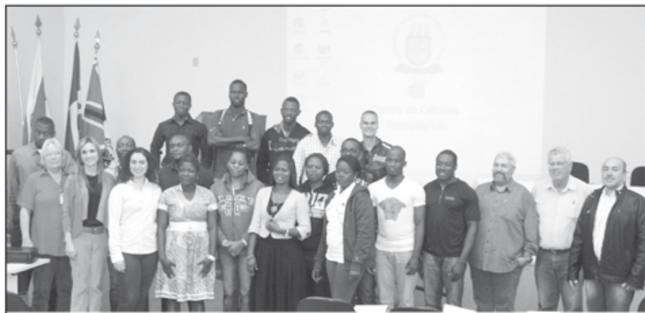
Grupo de estudantes da República dos Camarões visita Bandeirantes