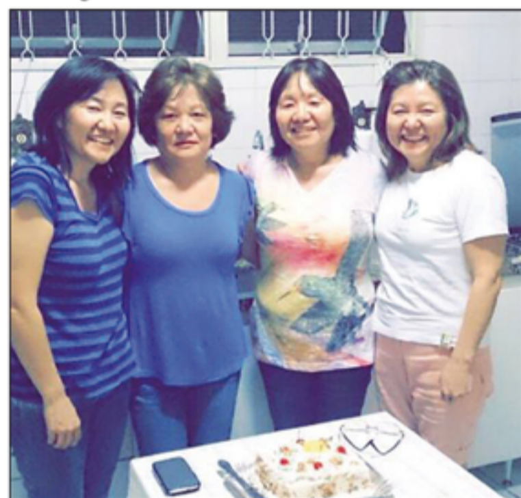
Grupo de artesãs 4S (Four Sisters)

No evento, apaixonados por trabalhos manuais, seja para comercialização ou por hobby, poderão visitar a Mostra de Arte, conversar com os mestres de cada área e participar de diversos cursos e workshops. Além disso, terão acesso direto a fabricantes e revendedores de aviamentos, máquinas de costura e muitos outros insumos da cadeia