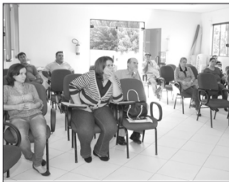
Debate e propostas para alimentação segura e saudável

O tema abordado foi "Comida de verdade, no campo e na Cidade: por direitos e soberania alimentar" que teve como finalidade debater as políticas públicas executadas no Município quanto aos trabalhos na melhoria da qualidade de vida, alimentação e saúde da população, garantindo o direito constitucional, que coloca a alimentação como