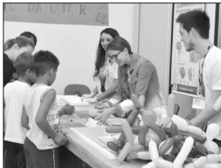
Alunos das escolas públicas e particulares visitaram e participaram de atividades nos estandes elaborados para o 'Conhecendo o Cérebro'

Assim como no ano passado, várias crianças, adolescentes e adultos, visitaram e aprenderam com as exposições lúdicas sobre o cérebro. Entre as atividades realizadas, a instalação de estandes sobre o Cérebro e a Percepção onde foram trabalhados visão, audição, tato, olfato e gustação; Estande do Cérebro com a Neuroanatomia e atividades para crianças com cérebro de gesso, pinte o cérebro e neuro-balão; no Estande Atividade Física e Saúde do Cérebro foi apresentada importância da atividade física para a cognição; na Estande de Prevenção de Drogas, informações sobre o tema foram abordados; Estande Sono foi debatido sobre o 'Por que temos Sono'; no LETED - Laboratório de Ensino e Tecnologia Educacional