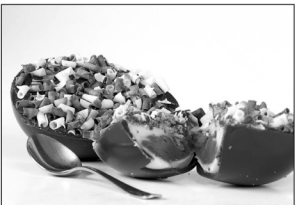
Curso vai ensinar a fazer ovos de chocolate na colher