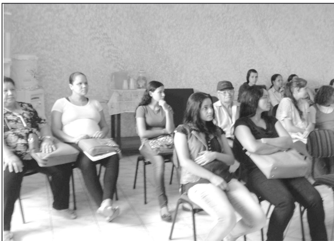
Atendimento das 07h às 11h30 e das 13h30 às 17h

Segundo o prefeito Celso Silva, a Câmara de Vereadores aprovou a locação do imóvel, no valor de R$ 3,5 mil/mês, para a realização de atendimento ao público-alvo até a conclusão da sede do Centro de Saúde, que está em reformas. “O local já está adequado, pois é na antiga Clínica Bandeirantes, onde o atendimento é direcionado às pacientes no pré-natal das