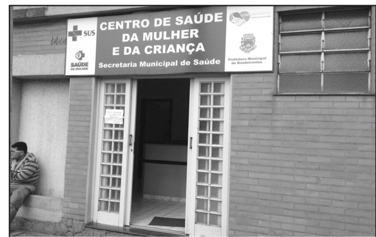
Funcionamento agora está na antiga Clínica Bandeirantes