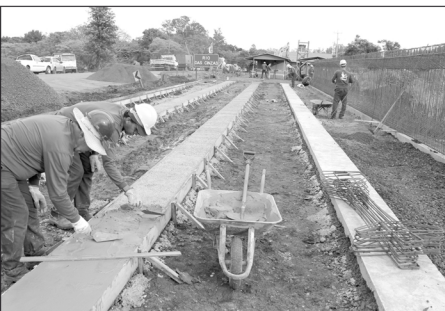
Início das obras da nova ponte; comunidades aguardam funcionamento provisório de balsa