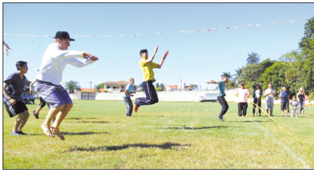
Gincana envolve participação de todas as faixas etárias

Durante todo o dia, atividades de competição individual e coletiva foram programadas e executadas por crianças, adolescentes, jovens, adultos e idosos. A gincana envolveu