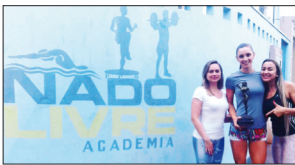
Atleta representando Badeirantes e a Nado Livre Academia