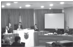
Audiência pública na ALEP do projeto do Novo Simples, disse que vem sendo procurado pelo empresário na tentativa de alisar essa tributação e considera que a alíquota é muito alta. O parlamentar afirma que o decreto 442/2015 traz um prejuízo enorme para os