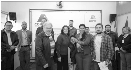
As chaves de 19 novas moradias rurais para famílias do município foram entregues na quinta-feira

Para terem mais privacidade, o casal construiu uma casa de