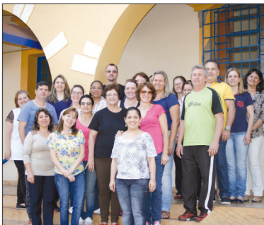
Resultado do IDEB do Colégio Nóbrega da Cunha foi acima da meta projetada