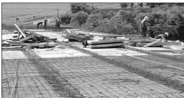
Ponte sobre o Rio das Cinzas: construção atinge 70%

A construção da nova ponte foi necessária após a antiga ter sido destruída em decorrência das fortes chuvas nos primeiros meses do ano. Para que o problema não