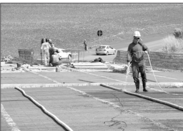
Obra já atingiu 85% de execução.