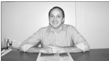
Prefeito Celso Silva, anunciou no início da semana o pagamento do terço de férias da Educação

queridas professoras, tanto que implantamos em 2014 o Plano de Cargos e Salários do Magistério Municipal, uma demonstração incontestada da nossa gratidão e reconhecimento pelas professoras. A antecipação do pagamento do terço de férias, significa o reconhecimento desse apreço e respeito. Agradeço a dedicação e apoio no desenvolvimento da educação nesses oito anos da nossa gestão. Muito obrigado e que Deus abençoe as educadoras com muita saúde", agradeceu o prefeito.