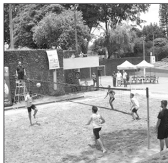
21ª edição da Copa Oswaldo Bernardes de Futvôlei

As comemorações ainda seguem durante a semana com atividades recreativas e esportivas, neste dia 15, na Praça Brasil, dia 18 tem a tradicional Prova Pedestre 15 de Fevereiro, de 25 a 28 tem Carnaval Popular na avenida 15 de Novembro, e dia 12 de Março, evento Show dos Shows no Parque de Exposições Arthur Hoffig. (Com informações da assessoria)