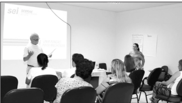
Proposta da oficina é mostrar importância da união de forças para melhorar