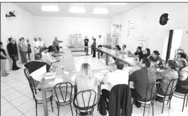
Gestores municipais do turismo da região participam de evento