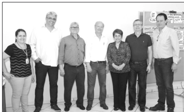
Orientação para participação do Plano Turístico

O Município de André participou do encontro e está articulando a inserção da cidade no mapa do turismo. Até então, André não estava inserida na relação de cidades que são contempladas com recursos e projetos para esta área.