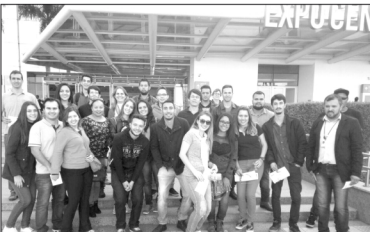
Grupo de acadêmicos da Unopar conheceu Feira Internacional