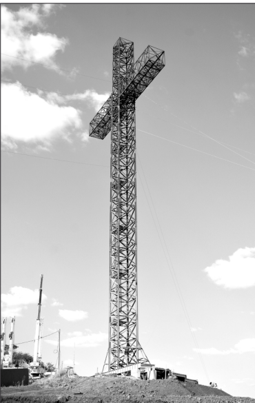
Estrutura da cruz já está concluída: 81 metros de altura (eixo central), o braço (de uma ponta a outra) possui 33 metros – representando a idade de Jesus Cristo