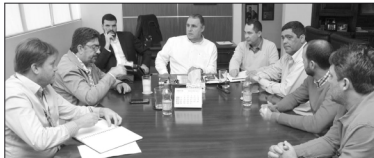
Técnicos da companhia visitaram o município nesta quinta-feira (10) para estruturar projeto e levantar a demanda pelo serviço oferecido pelo governo estadual