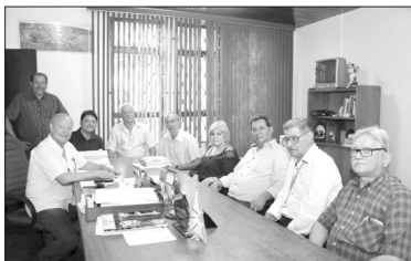
Reunião aconteceu no gabinete do prefeito Lino Martins

De acordo Traad, a visita nas regiões e nos municípios é constante e compõe a agenda de trabalho, desta forma, permite uma maior aproximação dos gestores municipais com o órgão do Governo do Estado. A ocasião também foi oportuna para se reunir com os servidores da Ciretran de Bandeirantes e ainda visitar as melhorias realizadas na infraestrutura da 22ª Ciretran. “Os trabalhos e investimentos em reformas, melhorias e