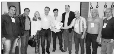
Assinatura do Termo de Cooperação Técnica

O projeto ‘Cidades Inteligentes’, por sua vez, é o novo escopo do consórcio, que hoje congrega mais de 150 municípios paranaenses. O Cindepar, idealizado pelo