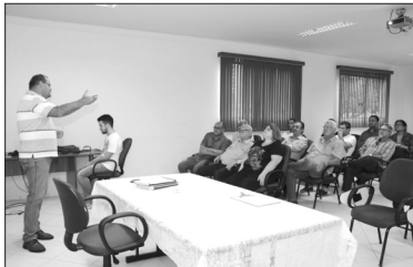
Audiência pública realizada para as alterações parciais