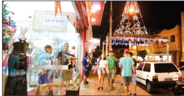
Consumidores têm até às 22h para realizar compras e ainda concorrer a prêmios pela ACIAB