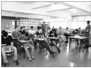
Fase de designação dos alistados aconteceu nesta semana

A etapa da designação é a fase em que o convocado toma conhecimento da organização militar onde poderá servir. Aquele que não se apresentar no local determinado dentro do prazo marcado, ou ausentar-