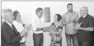
A clínica odontológica funcionará nos moldes das que já existem nas universidades estaduais