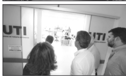
Richa também assinou convênio para a aquisição de equipamentos para a Santa Casa do município

governador também anunciou o investimento de R$ 2 milhões na Santa Casa de Jacarezinho. Os recursos serão utilizados para a aquisição de equipamentos que vão estruturar o centro cirúrgico da unidade, a UTI e o pronto-socorro. "São investimentos expressivos que vão proporcionar um atendimento de qualidade e mais humano, como fazemos em todo o Paraná", disse Richa.